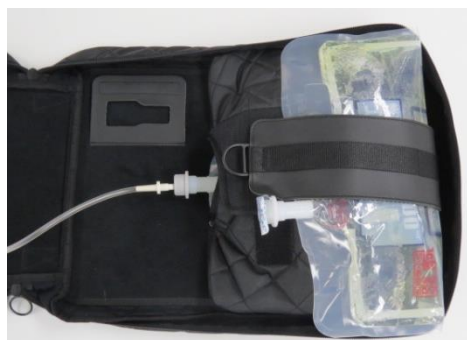
輸液剤を装着したところ