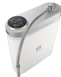
消臭除菌水生成装置 FW-AN08